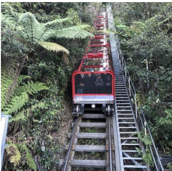
La timiga Scenic Railway