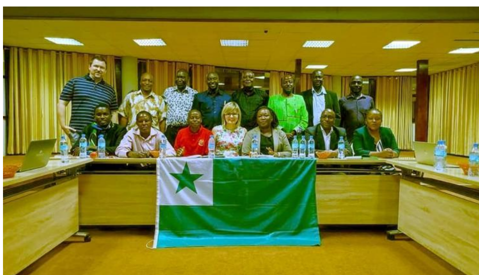
Esperantistoj el Tanzanio en la 108-a UK. En Tanzanio okazos la 109-a UK en 2024.