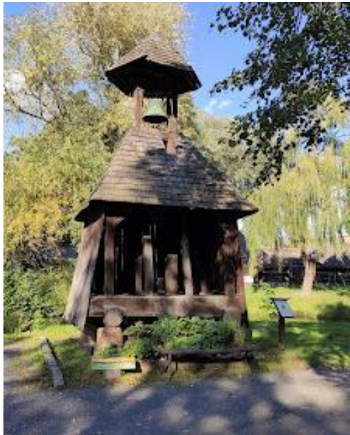
„Göcsei” Vilaĝmuzeo (Sonorilstablo)

Apud la urbo Zalaegerszeg oni elformis imageblan vilaĝon, kie oni konstruis kvardek