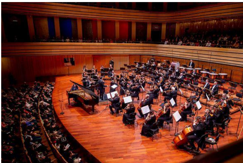
La MÁV Simfonia Orkestro koncertas en la Muzika Akademio

esperon kaj kuraĝon al la koroj por la rekomencado. Li efektivigis specialan fervojan vagonaron, en kiu formigis dormkupeon por la muzikistoj, kaj en alia vagono oni lokigis la muzikinstrumentojn. Per tiuj vagonoj vojaĝis la orkestro en la tuta lando, kaj donis koncertojn en multaj hungaraj urboj. Komence la orkestro konsistis el amatoraj muzikistoj kaj el la blovorkestroj de MÁV, sed poste ĝi iĝis oficiala grandorkestro. La unua dirigento estis Szóke Tibor, kiu formis veran simfonian kompanion el la amatoraj muzikistoj. Dum la paso de la tempo kuniĝis novaj altinstruitaj muzikistoj al la orkestro.