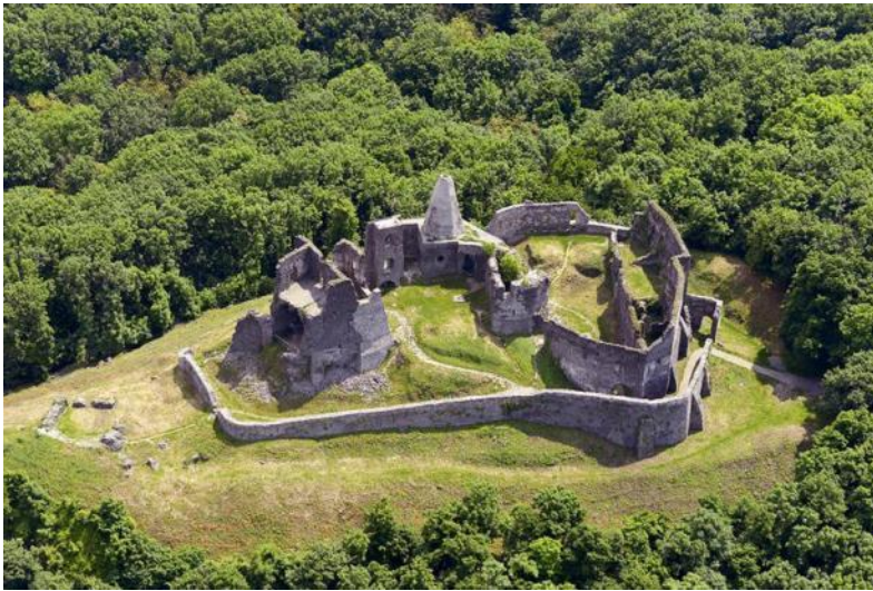
La fortikaĵo Somló

la fortikaĵo. Tiu fortikaĵo konstruiĝis sur vulkana konuso. La fortikaĵon antaŭlonge oni povis malfacile alproksimigi, ĉar antaŭ la enirejo estas okmetra seka foŝaĝo. La plandeseĝo de la fortikaĵo estas senregula, kaj havas internajn turojn kaj kelkajn kortojn. Sur la fendego transkondukas levponto, kiu sendifekte restis dum la