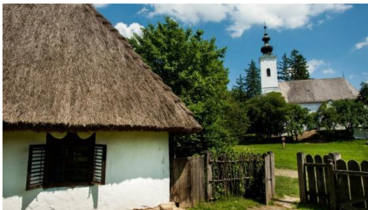
"Szennai" Subĉiela Etnografia Muzeo

La kuriozaĵo de tiu skanseno estas, ke oni elformis ĝin en la mezo de la vivanta samloka vilaĝo. Pro tio la skanseno ricevis „Eŭropa Nostra” internacian premion. Ĝi prezentas la arkitekturon kaj la tradicion de la naturparko „Zselic”, kaj multaj kulturaj programoj atendas la vizitantojn. Multfoje okazas dancaj amuzoj kaj metiistaj okupiĝoj. Al la skanseno apartenas la barokstila preĝejo, konstruita en 1785, kiu staras sub protekto pro la karakterizaj kasonoj de la plafono. La skanseno estas fama pro la planddomoj, kiujn entuziasmajn vilaĝanoj transportis el la Sud-