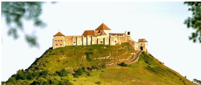
La fortikaĵo Sümeg

La alia fortikaĵo estas Sümeg , kie „la historio revivigas”. La fortikaĵo altiĝas sur la monteto de la urbeto Sümeg, kiu regas la pejzaĝon kaj altiras la rigardon. En la murego troveblas multaj bastionoj. Ĝi estas unu el la plej belaj mezepokaj fortikaĵoj, kiu restis en konservita. En la fortikaĵo oni gardas la