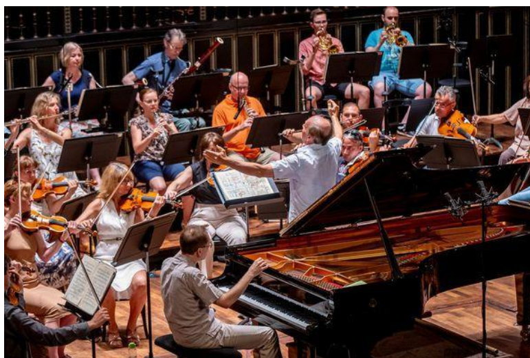
La provo de la orkestro en la provĉambrego

La orkestro regule kunlaboras kun la Budapeŝta Printempa Festivalo, la Miŝkolca Internacia Operfestivalo, la Budapeŝta Festivalorkestro, la Filharmonia Orkestro en Budapeŝto. La orkestro koncertas en Hungario ne nur en Budapeŝto, sed ankaŭ en la provincaj urboj. La granda artista sciado estas rekonata en la tuta mondo per la internaciaj gastroj. La orkestro jam koncertis preskaŭ en ĉiuj eŭropaj landoj, krome en