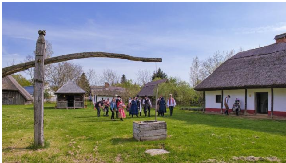
La korto de la "Sóstói" Skanseno.