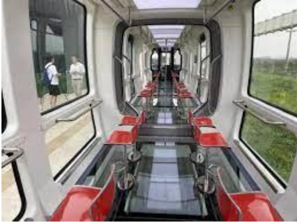
La Hanging Train

11,5 km-ojn longan fervojan linion. La malpezajn vagonojn ĉinoj konstruis el karbonfilamento kaj kompozita ŝaumo-materialo.