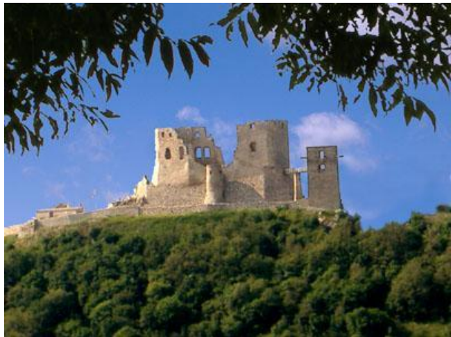
La fortikaĵo Csesznek

La vilaĝo Csesznek troveblas en la norda parto de la montaro Bakony, kiun sorĉigas la harmonioj de la valoj, altplataĵoj, montoj kaj riveretoj. Apud la vilaĝo estas sur elstariĝa kruta roko la 700-jara belega fortikaĵo Csesznek, kiu estas la plej vidinda fortikaĵruino de la montaro Bakony, kaj apartenas al la plej belaj ekskursejoj de la lando. La unuaj skribaj fontoj mencias en la XIII-a jarcento la csesznekan fortikaĵon, kiun konstruigis Cseszneki Jakab. Poste la fortikaĵon oni alikonstruigis, per kio ĝi iĝis impona kavalira kastelo. Dum la jarcentoj la fortikaĵo plurfoje ŝanĝis posedantojn. En la periodo de la turkoj la fortikaĵo iĝis limfortreso, kaj ĝi