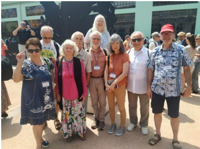
Fervojistaj esperantistoj dum la kongreso

Ĉe la sole- na fermo prezentiĝis infanoj en sia kongreseto, kaj ĉe la fino estis transdonita la Esperanto-flago al la reprezentantoj de la venonta UK en Tanzanio. Ĉiuj estos bonvenon partopreni la kongreson okazantan unuafoje en la Afrika kontinento. Kion diri ĉe la fino? Koncize, ke ĝi estis tradicia kongreso kun tradiciaj temoj, konferencoj, amuzaĵoj. La Landa Kongresa Komitato preparis buntan kaj interesan semajnan programon kaj zorgis pri ĝia bona disvolviĝo. Do, gratulon al la organizantoj de tiu ĉi impona evento.