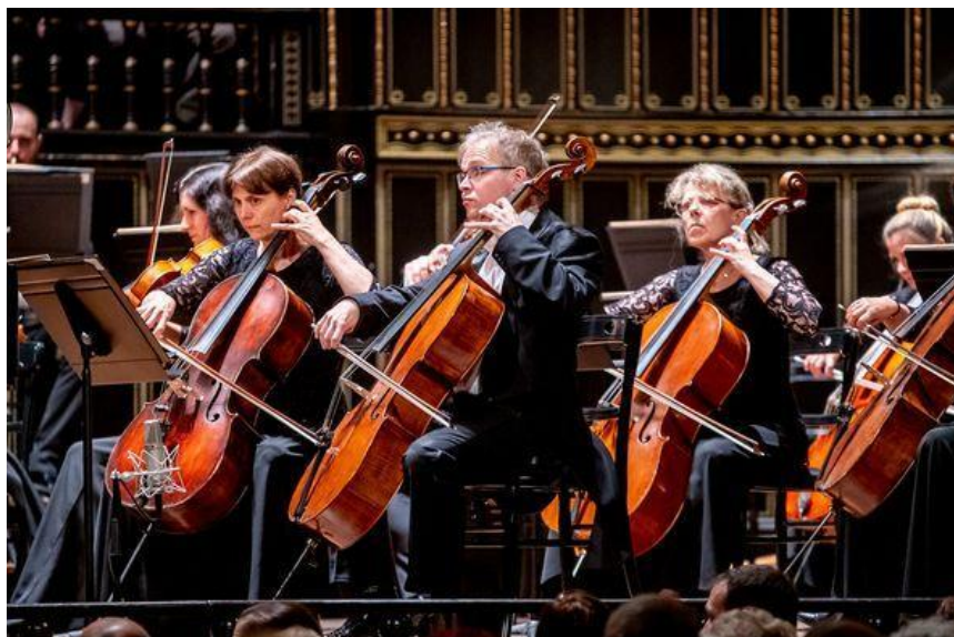
La muzikistoj dum la koncerto

La orkestron komandis multaj famaj dirigentoj, nur kelkaj nomoj el inter la eminentaj artistoj: Kurt Masur, Ferencsik János, Kodály Zoltán, Rózsa Miklós, Lamberto Gardelli, Franco