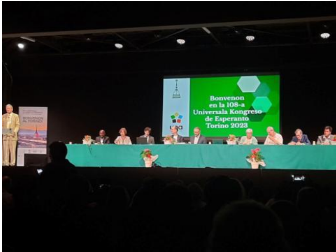
La prezidio de la kongreso dum la inaŭguro