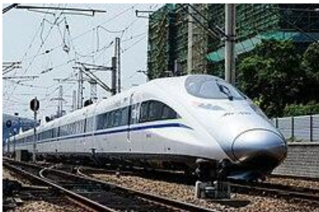
La grandrapida trajno en Ĉinio

La Ĉina Radio Internacia sciigis gravan novaĵon pri la neimagebla plano de la Ĉina Fervojo. Laŭ tio la Ĉina Fervojo planas konstrui pli ol 3.000 km-jn da fervojoj en la jaro 2023, inkluzive de 2.500 km-jn da rapidegaj fervojlinioj por altgradigi la transportan sistemon en progresintan reton. Se ni ekzamenas la statistikajn indikojn pri la ĉina fervojreto, ni devas kredi, ke tiun planon la ĉinoj efektiviĝas. Laŭ mia informo en la unua duonjaro la granda parto de la plano jam efektiviĝis.