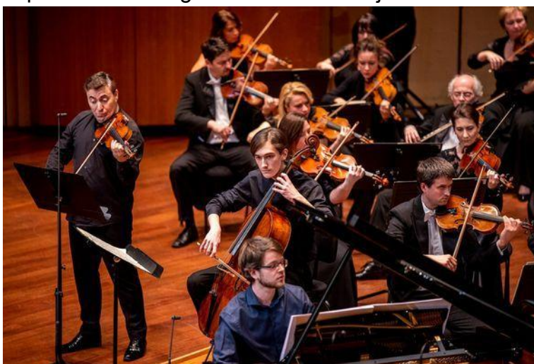
La violonistoj dum la koncerto

La hungaraj fervojistaj esperantistoj antaŭ kelkaj jardekoj havis jarajn abonbiletojn al la koncertoj de la MÁV Simfonia Orkestro. Ni ĉiuj ege ĝuis la altnivelajn koncertojn, pri kio aperis artikolo en nia faka revuo Hungara Fervojista Mondo.