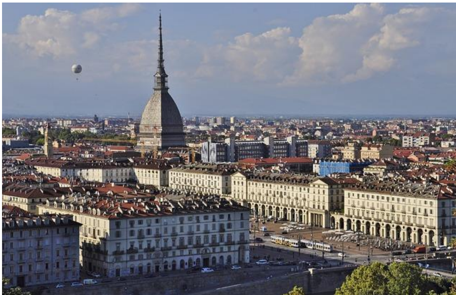
La kongresurbo Torino

En Torino jam okazis pluraj Esperanto-kongresoj. Ĉi-foje la kongresejo situis en la