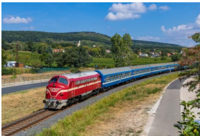
Nohab prenas pasaĝertrajnon apud la Balatono

En la lastaj jaroj individuaj iniciantoj prenis sub protekton de la Nohab-aferon, kaj kelkajn lokomotivojn oni riparis, kelkaj ricevis protekton por la Trafika Muzeo. Nuntempe MÁV jam ne havas Nohabojn, sed – ĉefe ĉe la Balatono – kelkaj funkcikapablaj Nohaboj trafikis kiel nostalgia lokomotivo.