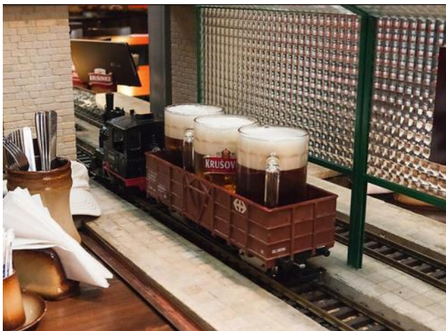
Vojaĝas la bieroj al la gastoj

deflankiĝon. Tiu fervojreto estas iomete komplika, ĉar la posedantoj devis efektivigi dum kelkaj jaroj tiun interesan planon. La trajnoj traveturas arbaran kaj rokan regionon, kaj klakadas tra tuneloj kaj pontoj, por ke ili povu transporti la bieron al la gastoj. Okaze de la iama estrarkunsido de IFEF, la estraranoj kaj la ĉeĥaj kolegoj vizitis tiun restoracion, kaj ni trinkis pere de la vagonoj kunportitajn bierojn. Ni ege ĝuis la viziton, ĉefe la bongustan bieron.