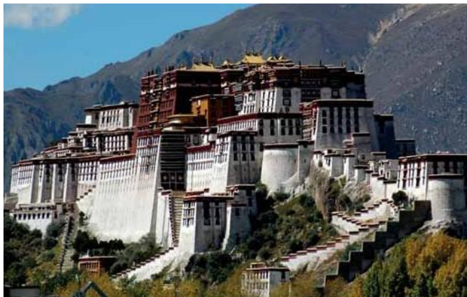
La "Potala Palaco" en Lhasza

La konstruo de la Csinghaj – Lhasza (Tibeto) fervojlinio komenciĝis en la jaro 2001, kaj dum 5 jaroj ĝi konstruiĝis, kio estis giganta plenumo. La longo de la linio estas 1142 km-j, el kiu konstruiĝis 960 km-jn super la marnivelo pli ol 4000 m altecoj. La plej alta stacio de tiu fervojlinio estas Tang Gu-la, kiu konstruiĝis sur 5068 metrojn alta. La kostoj de la konstruo estis 3,3 miliardojn da Eŭroj.