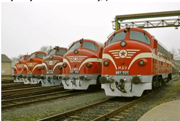
Vohaboj en la stacidomo Budapeŝt-Ferencváros

La dizellokomotivoj Nohab havas sesdek jaraĝojn, ĉar la fabrikado de la sveda „stalmiraklo” komenciĝis en jaro 1963. Tiuj lokomotivoj ricevis la identigan numeron M61, kaj tiam enfokusiĝis la aĉetado de tiu lokomotivo en Hungario, kiam la vaportrakcio komenciĝis regresii. MÁV planis evoluigi la dizelizadon kaj elektrizadon, kaj al ĉi tio estis bezonata novaj grandpovumaj dizellokomotivoj. Ĉar en tiuj jaroj ankoraŭ nur kelkaj fervojlinioj estis elektrizitaj, pro tio aĉetado de elektraj lokomotivoj ne estis aktualaj.