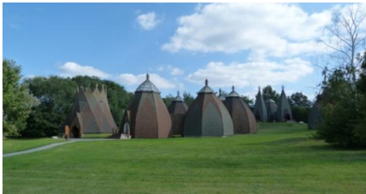
"Ópusztaszeri" Subĉiela Etnografia Muzeo („Csete”-jurtoj)

ĉiĝas al la Nacia Historia Memorparko. Tiel videblas en la ronda vizitanta centro, „Rotunda” la „Feszty-rondpentraĵo”, kies titolo estas „Enpatrujiĝo de la hungaroj”. Okazas multaj interaktivaj kaj hidrologiaj ekspozicioj. Inter la eksteraj vidindaĵoj oni povas rigardi la nomadan parkon, ruinan ĝardenon, kronan jurton kaj la kuriozformajn „Csete”-jurtojn. Komune kun la Nacia Historia Memorparko la skanseno organizas multajn eventoseriojn, inter alie rajdospektaklojn.