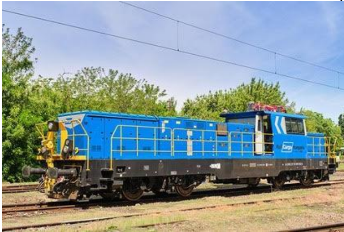
La elektra manovra lokomotivo

de la akumulatoro estas el la katenario dum 2,5 horoj, kaj el elektra reto estas dum 8 – 10 horoj. La lokomotivo estas medioindulga, kaj la maksimuma rapido estas 100 km/h. Post la ŝtata permeso de la veturilo ĝi faros priservon sur la ranĝostacioj kaj la industritrakoj, ĉar tie ne estas katenario super la trakoj. Ĝis nun sur tiuj trakoj oni faras la manovradon per dizellokomotivoj. La elektra manovra lokomotivo reprezentas senegalan teĥnologion en Eŭropo.