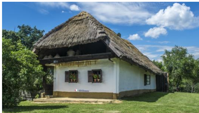
„Őrségi” Popolaj Monumentoj

konsistas el ok partoj, inter tiuj la plej bela estas la „Pityerszer”. La subĉiela muzeo gardas la malnovajn vivoformojn, kaj ankaŭ la domojn kiuj gardas la karakterizajn trajtojn. Sur la montetoj troveblas kelkaj domoj, kiuj estas malstrikta komunaj formoj de la kolonioj. La ĉi tie vivantaj homoj elformis dum jarcentoj la mozaikajn bildojn de la pejzaĝo. La tradicia konstrumaterialo estis eĉ estas la ligno. La plej praforma domtipo de la teritorio estis la fumoplena domo. Apud la domoj troveblas la t.n. „toka”, kion oni uzis por la kolekto de trinkakvo. En la limo de „Szalafő” kaj „Pityerszer” videblas unu el la plej romantikaj skanseno de Hungario. La karakterizaj domoj ekstere kaj interne redonas fidele la iaman vilaĝan realaĵon.