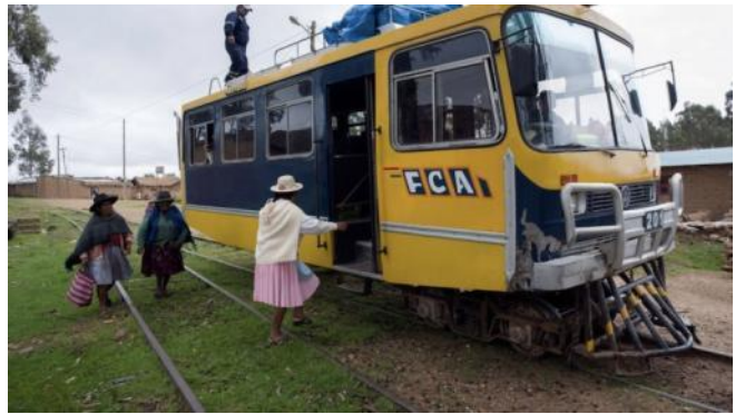
La Ferrobusedoj kaj la vojaĝantoj

el karoserio de malnovaj ŝoseaj veturiloj kaj fervojaj radoj. Tiuj malstabilaj veturiloj signifas por la malproksimaj montaj vilaĝoj veran savrimedon, kiuj tute ne havas oficialajn koneksajn vojojn. La ferrobusedoj uzas la forlasitajn fervojliniojn, kiujn oni konstruis en la 19-a jarcentoj al la minado de la mineralriĉaĵo. La fervojliniojn de la ferrobusedoj oni povas trovi en Cilio, Bolivio kaj Kolombio inter la montopintoj de la montaro Andoj. La ferrobusedoj estas populara por la turistoj, kiuj serĉas la danĝerajn veturadojn kaj la nekonatajn travivaĵojn. Bolivio estas la citadelo de la ferrobusedoj, kie sur tri fervojlinioj trafikas tiuj busoj. La vojaĝo per ferrobusedoj estas harstariga travivaĵo, kaj memorinda evento.