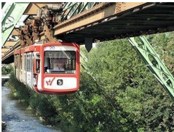
La Wuppertala telfero

Tiu unurela fervojo troveblas en urbo Wuppertal. La malvasta Rivero Wupper fluas tra serpentuma valo, kie estis kelkaj malgrandaj industriaj urboj, kiujn kunligis tiu telfero jam en 1901. Tiu telfero pogrande helpis la evoluadon de tiuj industriaj urboj, kaj en jaro 1929 ili kuniĝis kun la urbo Wuppertal. Tiu telfero estas la spino de la pasaĝertransporta reto en la urba trafiko. La traceado de la telfero sekvas la vojkurbojn de la rivero, kaj alte kondukas super la