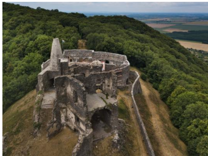
La fortikaĵo Rezi

La fortikaĵo konstruiĝis en la fino de la 1200-aj jaroj, kiun la skribaj dokumentoj unue menciis en jaro 1333. Kiel ĉiujn fortikaĵojn dum la jarcentoj posedis multaj riĉaj aristokratoj kaj reĝoj, ankaŭ la sorto de la fortikaĵo Rezi estis sama. En la 1580-aj jaroj la fortikaĵon aĉetis la familio Pethő, sed la reordigaj laboroj elĉerpiĝis la resursojn de la familio, kaj la familio parte faligis la fortikaĵon. Tiam pereis du turoj kaj la granda parto de la muregoj. Poste la familio Festetics aĉetis la ruinan fortikaĵon, sed ĝi plu detruigis. En