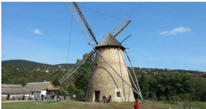
"Szentendrej" Subĉiela Etnografia Muzeo (Ventmuelilo)

Alvenis la aŭtuno, kiu estas la tempo de la ekskursoj. Unu el la plej interesaj ekskursaj programoj estas la vizitoj al la skansenoj, kaj tie oni povas konatiĝi kun la plurjarcentaj popolaj arkitekturoj, mastrumoj kaj vivmanieroj. En la skansenoj la