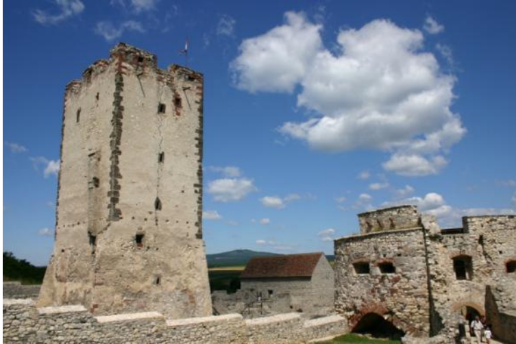
La fortikaĵo Nagyvázsony

La tria fortikaĵo estas Nagyvázsony , kiu estas „la fortikaĵo de la heroo Kinizsi”. Ĝi troveblas sur la dekliveto de la Altlando de Balatono. La fortikaĵo konstruiĝis apud la rivereto. Ĝi ricevis sian bonfamon de la „Muelŝtona Bravulo” Kinizsi Pál, kiu ricevis