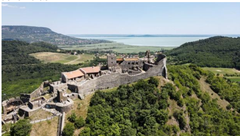
La fortikaĵo Szigliget

La fortikaĵruinoj same apartenas al la balatona pejzaĝo kiel la vinberoj, premildomoj, somerdomoj aŭ kapeloj. Kelkaj ruinoj restis kiel ŝtonamaso, aliajn la turistoj povas vizitadi kaj ĉirkaŭiri, ĉar tiujn ruinojn oni renovigis. Multaj fortikaĵoj troveblas en la Altlando de la Balatono, eĉ ankaŭ ĉe la suda parto de la lago troveblas kelkaj fortikaĵoj. Kelkajn fortikaĵojn mi iomete detale prezentas, kaj la aliajn mi nur denombros.